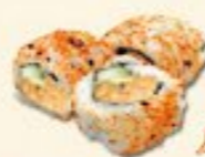
40. Spicy Salmon Pittige zalm 3 st.