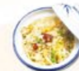
56. Yaki Meshi Gebakken rijst