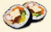
35. Futo Maki Grote rol 2 st.