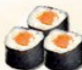
33. Sake Maki Zalm 3 st.