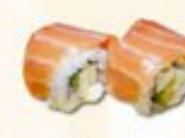
38. Salmon Cheese Maki Zalm kaas 2 st.