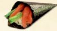
25. Maguro Temaki Tonijn handrol