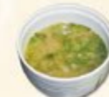
49. Miso Soup Japans sojabonen soep