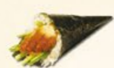
28. Unagi Temaki Paling handrol