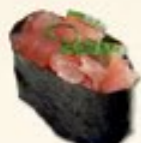
20. Maguro Sarade Tonijnssalade