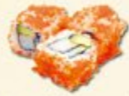
36. California Maki California rol 3 st.