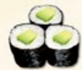
30. Avocado Maki Avocado 3 st.