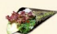
27. Avocado Temaki Avocado handrol