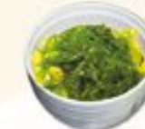
52. Chuka Wakame Sarada Zeewier salade