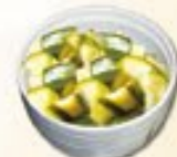
51. Tsukemono Zure komkommers