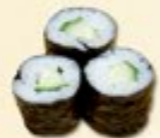
29. Kappa Maki Komkommer 3 st.