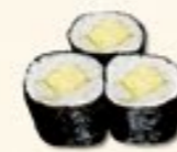
31. Tamago Maki Zoete omelet 3 st.