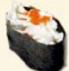
17. Crab Krabsalade