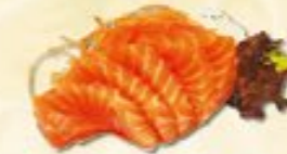
46. Sake Sashimi Zalm sashimi