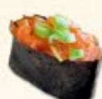
21. Sake Zalmtartaar