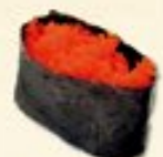
16. Tobiko Viskuit