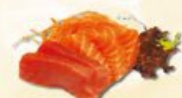
48. Sashimi Mix Mix sashimi