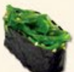
19. Chuka Wakame Zeewier