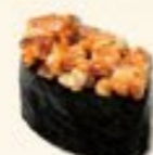
22. Unagi Paling