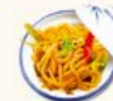
57. Yaki Udon Gebakken bami