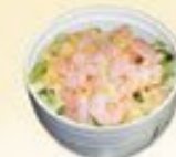
55. Ebi Sarada Garnalen salade