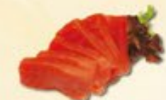
47. Maguro Sashimi Tonijn sashimi