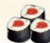
34. Maguro Maki Tonijn 3 st.