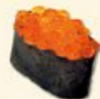
18. Ikura Zalmkuit