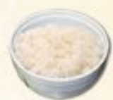
58. Meshi Witte rijst