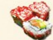
41. Wasabi Sake Verse zalm avocado 3 st.