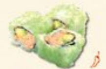
39. Spicy Tuna Pittige tonijn 3 st.