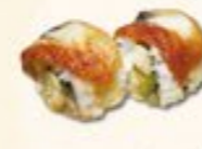
37. Unagi Maki Paling 2 st.