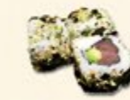
42. Wasabi Maguro Verse tonijn avocado 3 st.