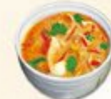
50. Tom Yam Soup Thaise pittige soep