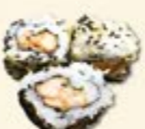
44. Crispy Salmon Krokante zalm 3 st.