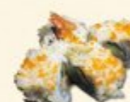
45. Dragon Roll Gefrituurde garnaal rol