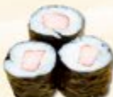
32. Kani Maki Krabsticks 3 st.