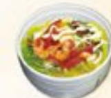
54. Sashimi Sarada Sashimi salade