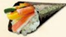
23. California Temaki California handrol