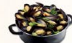
59. Mosselen Jumbo 1 kleine pot

Voor volledige prijzen mag per klant per gerecht een keer bestellen