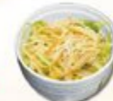
53. Kani Sarada Krab salade